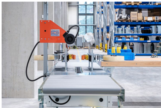
Blick auslaufseitig auf den Kartonverschleißer ST-10.