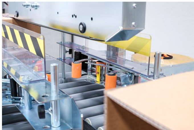
Zuverlässiger Kartonverschluss rechts und links.