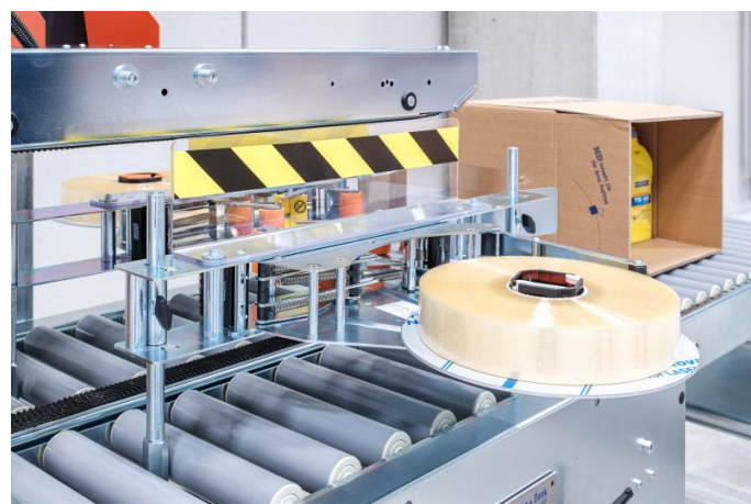
Die seitlich sitzenden Klebebänder können einfach gewechselt werden.