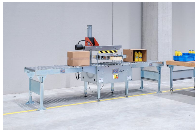
Der seitliche Kartonverschluss lässt sich mit der ST-10 kompakt darstellen.

Je nach Kartonspektrum haben Sie die Wahl zwischen dem Kartonverschießer des Typs ST-10 oder ST-10 Maxi.