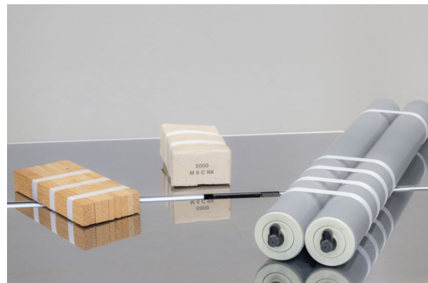
Kleine Produkte und Rundkörper lassen sich problemlos umreifen.