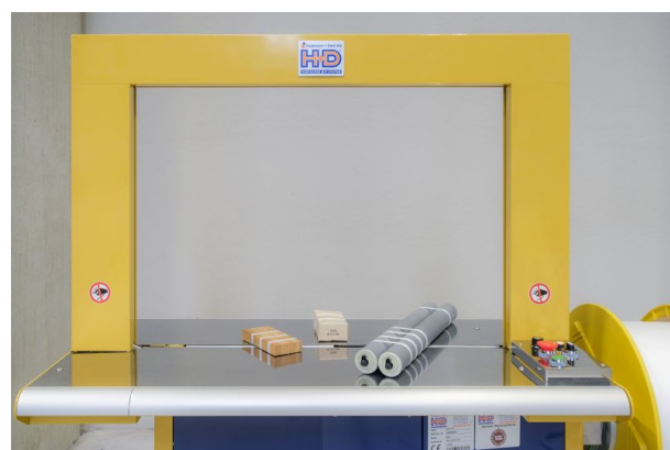
Neben sehr kleinen Produkten können auch alle üblichen Kartons oder Behälter umreift werden.