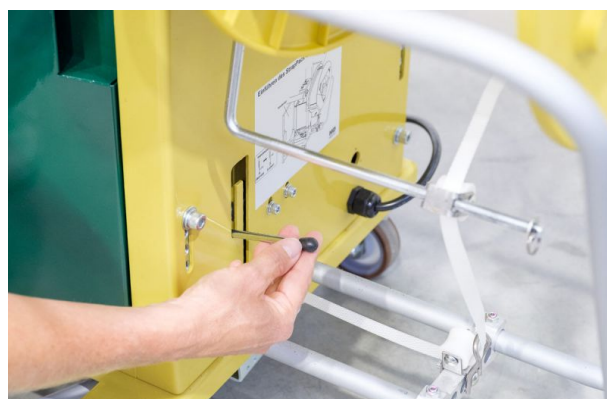
Automatische Bandedfädelung bei Rollenwechsel.