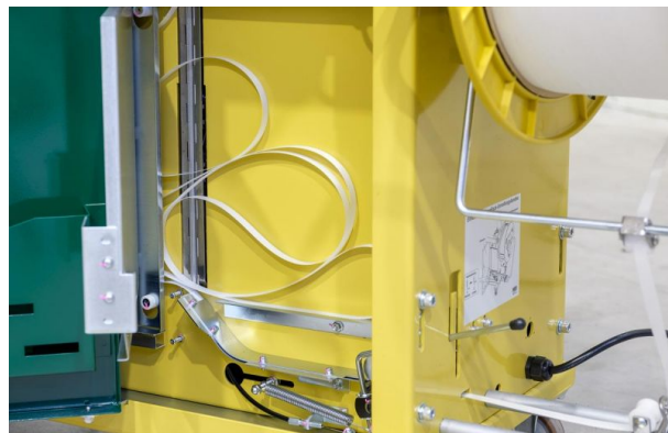
Bandbevorratung im Bandspeicher garantiert eine schnelle Taktzeit.