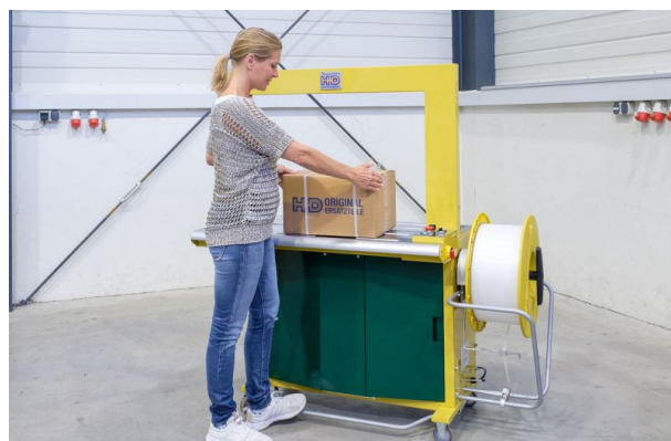
Über die Fußtrittleiste wird die Umreifung ausgelöst.