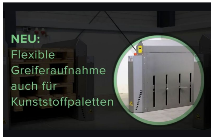
Mehr Flexibilität durch flexible Greiferaufnahme

Ein Sicherheitsvorhang im Einfahrtsbereich des Palettenmagazins überwacht die ordnungsgemäße Entnahme und Zuführung der Paletten und kontrolliert, ob sich eine Person im Arbeitsbereich befindet.