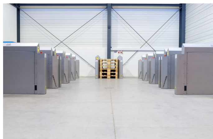
Das Palettenmagazin lässt sich auf unterschiedliche Palettenbreiten innerhalb 5 Min. umrüsten